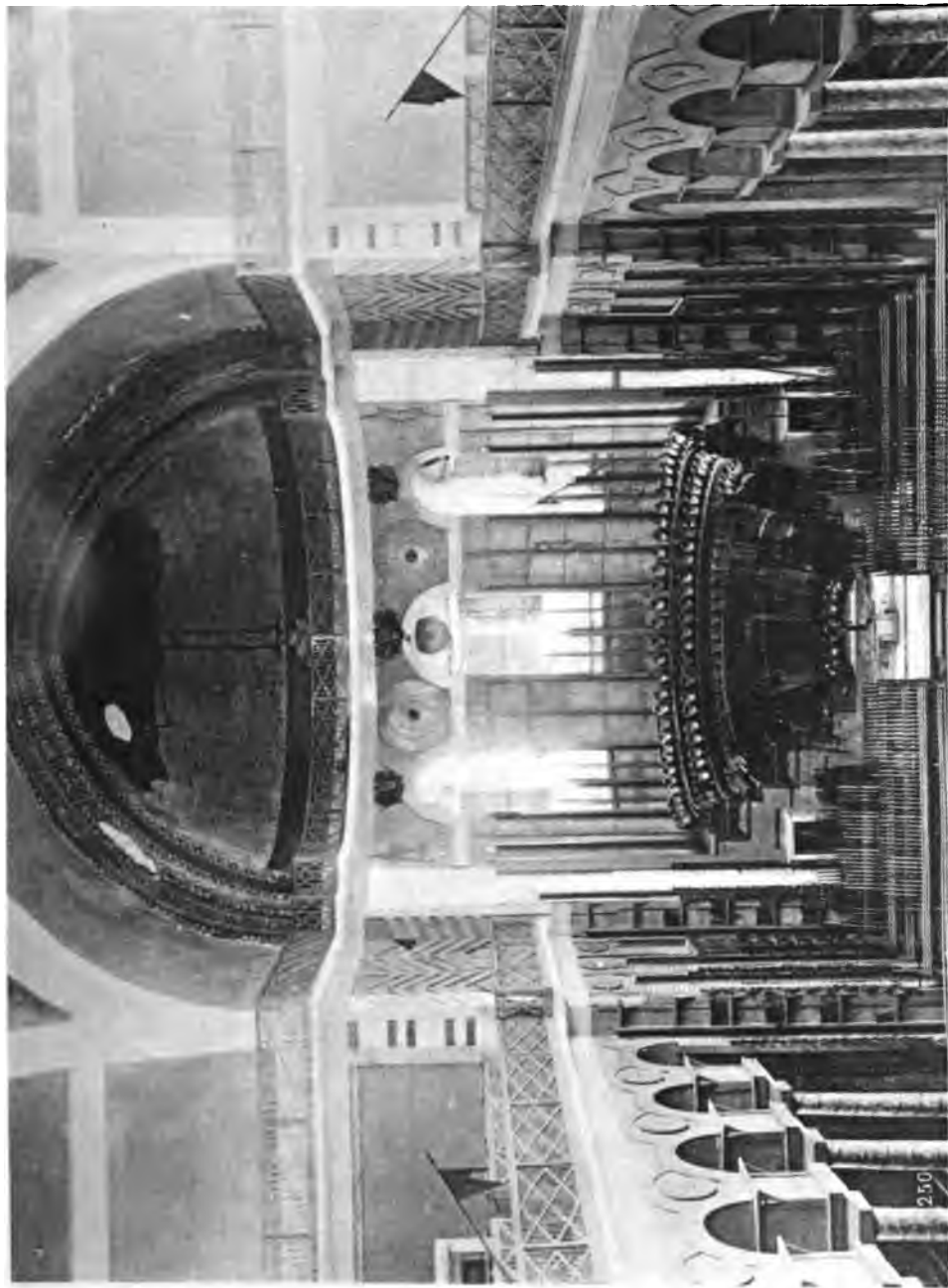
Восточная часть храма св. Троицы и алтарная конха съ сопределиемъ.